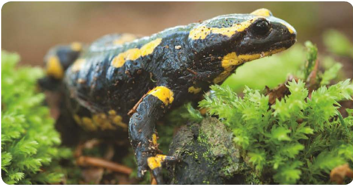
Vuursalamander - Dommelvallei